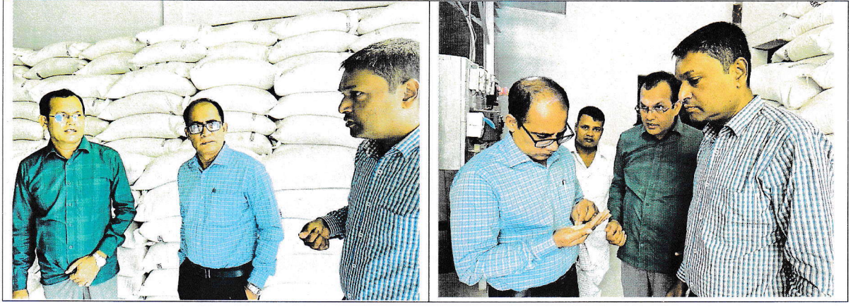
পুষ্টিচাল মিশ্রণ কারখানা পরিদর্শনের ছবি।